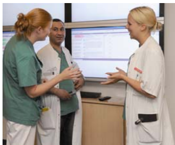
Klinisk foto, Skopet

En forudsætning for fortsat vækst og udvikling i Region Midtjylland er, at vi kan tiltrække og fastholde den fornødne arbejdskraft med de rette kompetencer og kvalifikationer!