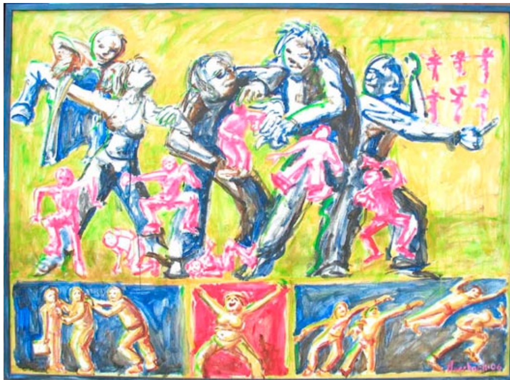
HR-staben i Faaborg-Midtfyn bliver klædt på og finder fælles retning. Kunstner: Karsten Auerbach

86 ud af de 98 nye kommuner vælger at sammenlægge løn/personaleadministration og personaleudvikling i én HR-enhed.